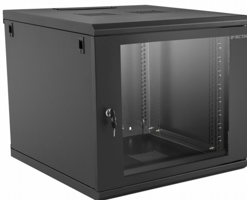
Fig. 1: Rack 12U.

ventiladores. Deve acompanhar o conjunto quatro pés niveladores; Pintura pó em micro epóxi na cor preta RAL 9004.