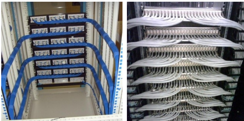
Fig. 2: Detalhe da organização de cabos UTP no rack já conectorizados.

A organização dos cabos entrantes nos patch panels, onde os primeiros 12/24 cabos devem entrar ao lado direito e os 12/24 restantes do lado esquerdo, evitando grandes concentrações de cabo de um único lado. Os patch cords entre os patch panels e os equipamentos também devem seguir o mesmo padrão com amarração dos cabos na frente dos equipamentos com velcros.