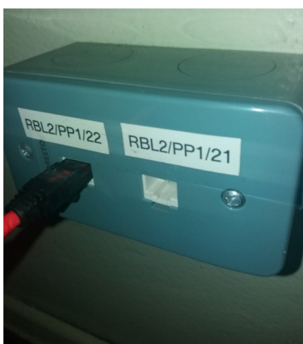
Fig. 6: Ponto de rede x2 devidamente identificado.

O padrão de identificação obrigatório, em concordância com a norma TIA/EIA 606. Esta identificação é válida para qualquer componente do sistema, independente do meio físico. A identificação sempre conterá no máximo treze caracteres alfanuméricos. Esses treze caracteres são divididos em subgrupos que variam de acordo com as funções propostas. As etiquetas de identificação a serem instaladas junto aos componentes deverão ser legíveis (executadas em impressora), duradouras (não descolar ou desprender facilmente) e práticas (facilitar a manutenção).