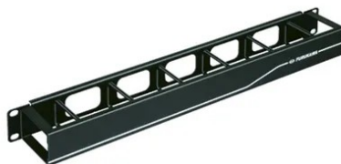
Fig. 4: Guia de cabos com tampa 1U.

Deve ser resistente e protegido contra corrosão, para as condições especificadas de uso em ambientes internos (ANSI/TIA-569).