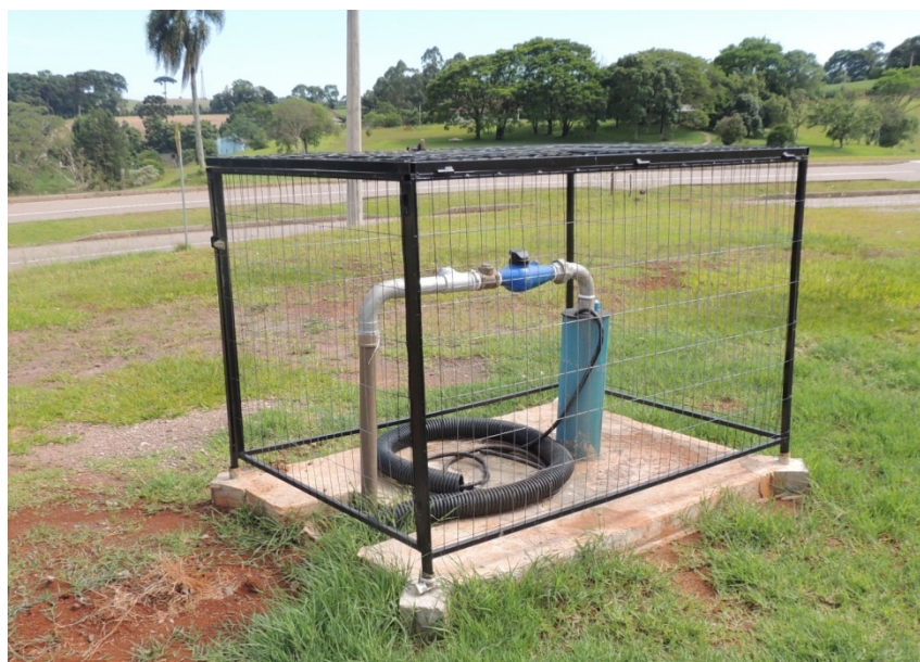
Figura 2: Modelo de cavalete

Todo o cavalete do poço (tubulação e dispositivos hidráulicos) deverá ser de aço galvanizado.