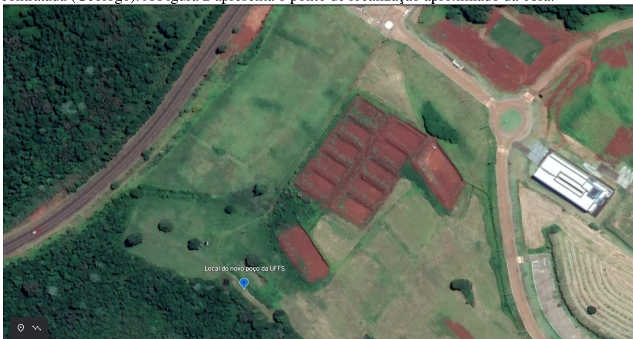
Figura 2: Ponto de localização aproximado da perfuração do poço artesiano -25°26'43"S - 52°26'49"W (SIRGAS 2000).

A perfuração do poço artesiano será realizada na área interna do Campus de Laranjeiras do Sul, em área de campo aberto, nas coordenadas aproximadas -25°26'43"S e -52°26'49"W (SIRGAS 2000). Contudo, o ponto exato de perfuração será definido pelo responsável técnico da empresa contratada (Geólogo). A Figura 2 apresenta o ponto de localização aproximado da obra.